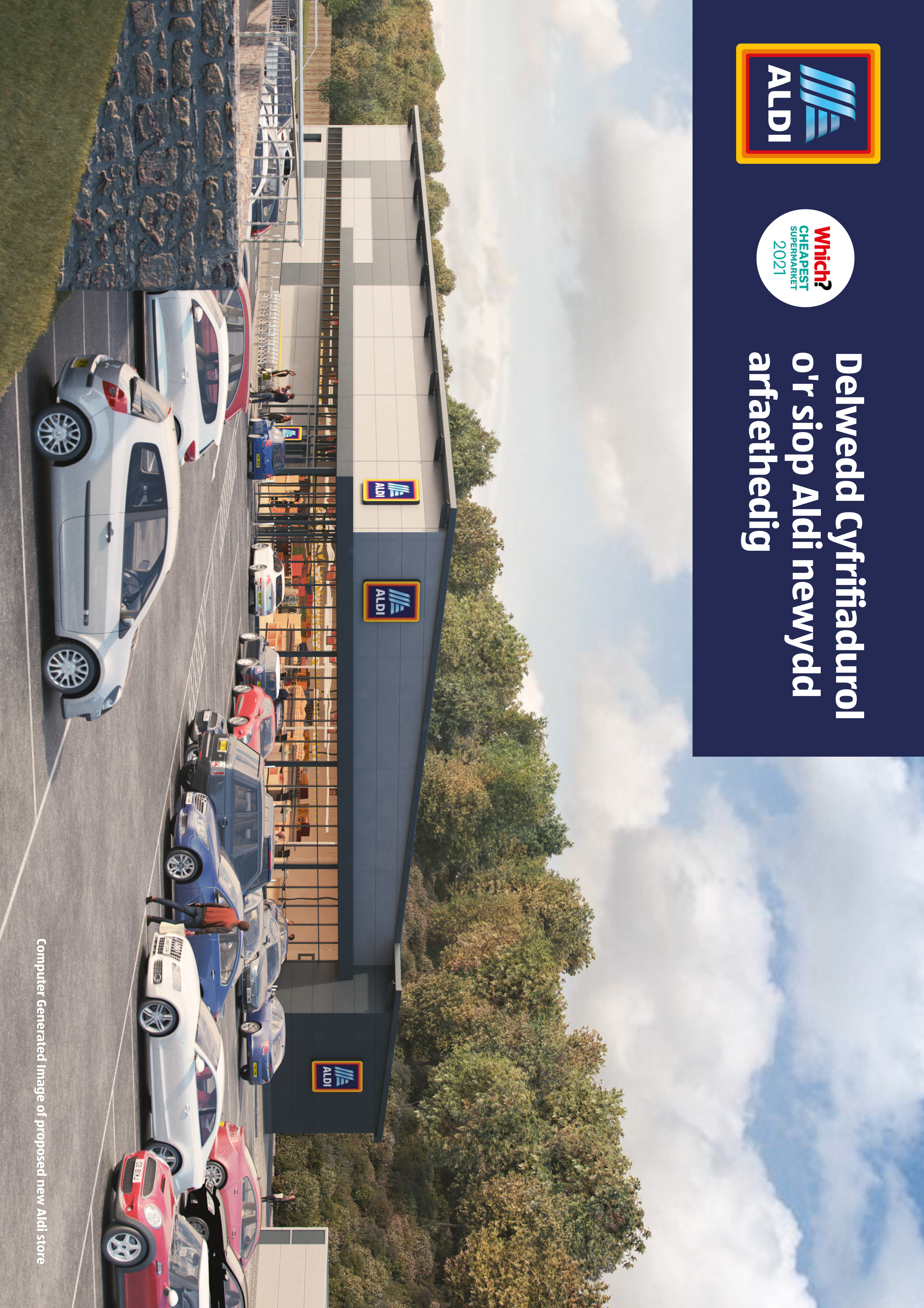
Computer Generated Image of proposed new Aldi store

Delwedd Cyfrifiadurol o'r siop Aldi newydd arfaethedig